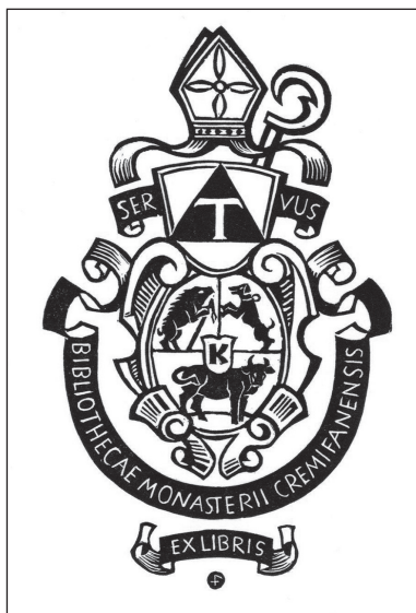
Exlibris der Stiftsbibliothek Kremsmünster mit dem Wappen des Altaltars (1982–2007) Oddo Bergmaier von Leopold Feichtinger (1919–1993), um 1990, Holzschnitt, 104 x 65 mm.

Sobald der Mensch in der Lage war, seine Gedanken schriftlich festzuhalten und sie auch wiedergeben zu können, entstand die Notwendigkeit, die »Schriftlichkeiten« vor Missbrauch zu schützen. Schon vom Altertum an wurden bei den Völkern Mesopotamiens Tontafeln mit Besitzervermerken einschließlich eines Fluches für Diebe und Missbrauch versehen. Viel mehr war später der Beschreibstoff Papyrus in Gebrauch, auf welchen die ägyptischen Könige Kartuschen setzen ließen. Erst in der Zeit der römischen Kaiser wurde der Kodex, das Buch schlechthin, »erfunden«. Man schrieb auf zugeschnittenen Tierhäuten, legte sie übereinander und band sie zwischen zwei Holzdeckeln zusammen. In der Völkerwanderungszeit und danach entstanden handgeschriebene Bücher fast ausschließlich in Klöstern des Abendlandes und wurden auch an andere Klöster weiter gereicht, um sie dort abzuschreiben und damit die eigene Bücherei zu erweitern. Mit dem Aufkommen des Buchdruckes waren Bücher nicht minder wertvoll. Das »handgemalte Exlibris«