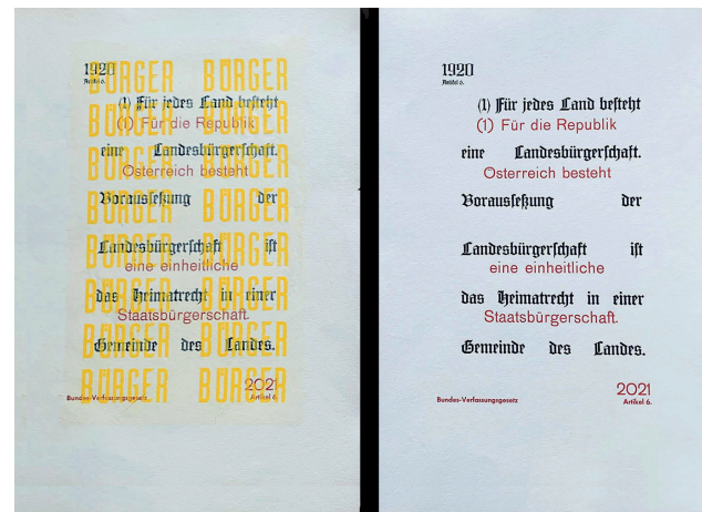
»11&11/Verfassungstexte«, gestaltet von Andreas Volleritsch, 2022.