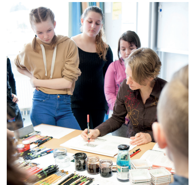
Schreibvorführung in der NMS Pettenbach