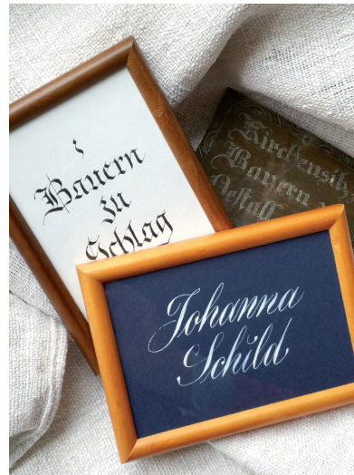
Alte und neue Kirchenschilder

Einige werden sich noch erinnern: Der eigene Platz in der Kirche wurde bezahlt und durch ein Namensschild aus Messing, Emaille oder Holz gekennzeichnet. Die schön gestalteten Schilder bildeten für sich ein Stück Identität und Kultur. Vor diesem Hintergrund wurden zum Jubiläumsjahr für Pettenbacher Familien, die sich an dem Projekt beteiligten, von der Kalligrafin Eva Pöll neue