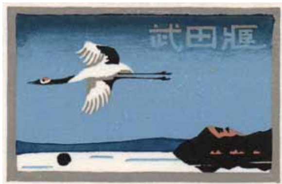
Yasushi Ohmoto, Farbholzschnitt

Die Ausstellung zeigt das Japanische Exlibris der letzten Jahrzehnte bis in die heutige Zeit. Mit Absicht ist Beispielen