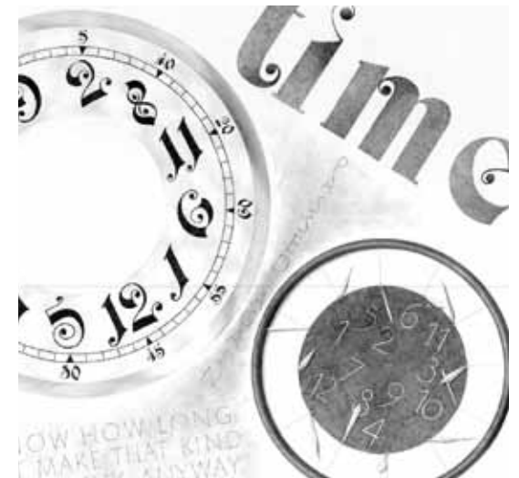
Eva Pöll: »time«, 2012. Bleistift, 102x88 cm

Aber vielleicht lässt sich nach dem Durchwandern dieser Ausstellung erahnen, wie man sich vor einem handgeschriebenen Blatt bebandzugt. Eva Pöll